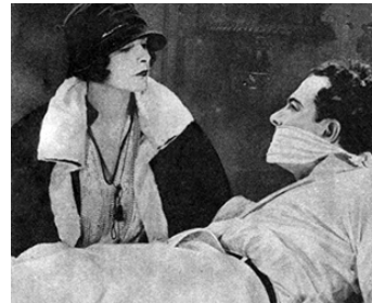
1924 THE ONLY WOMAN de Sidney Olcott avec Murdock MacQuarrie