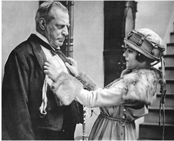
1916 FIFTY-FIFTY d'Allan Dwan avec J. W. Johnson