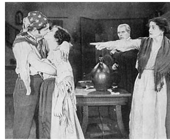
1921 DOLORÈS (The Passion Flower) d'Herbert Brenon avec Courtenay Foote, Julian Greer