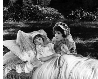
1923 CENDRES DE VENGEANCE (Ashes of Vengeance) de Frank Lloyd avec Jeanne Carpenter