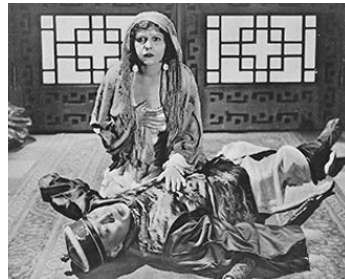
1918 LA CITÉ INTERDITE (The forbidden City) de Sidney A. Franklin avec Michael Raye