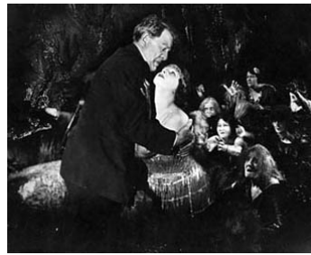
1920 LA FEMME FLÉTRIE (The Branded Woman) d'Albert Parker avec George Fawcett