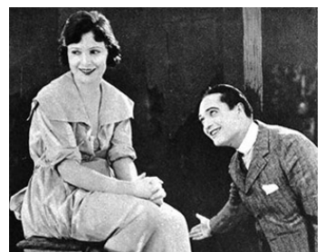
1920 À LA DÉRIVE (The Woman gives) de Roy William Neill avec Edmund Lowe