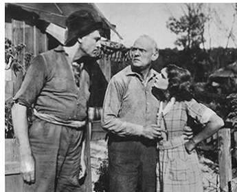
1917 LE SECRET DE DOLLY (The Secret of Storm Country) de Charles Miller avec Edwin Denison