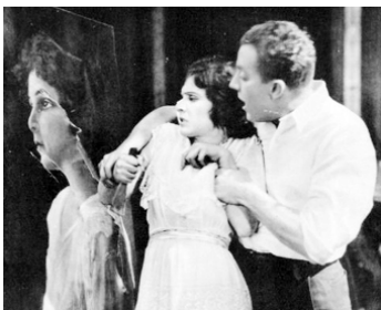
1918 THE GHOSTS OF YESTERDAY de Charles Miller avec Eugene O'Brien