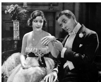
1919 SHE LOVES AND LIES de Chester Whitey avec Conway Tearle