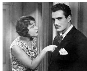
1929 LES NUITS DE NEW YORK (New York Nights) de Lewis Milestone avec Gilbert Roland