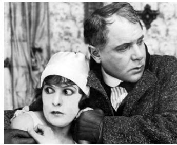
1916 CORRUPTION (Going straight) de Sidney et Chester Franklin avec Ralph Lewis