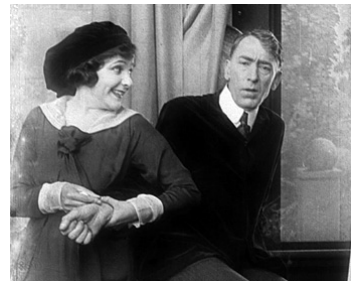
1916 THE DEVIL'S NEEDLE de Chester Withey avec Tully Marshall