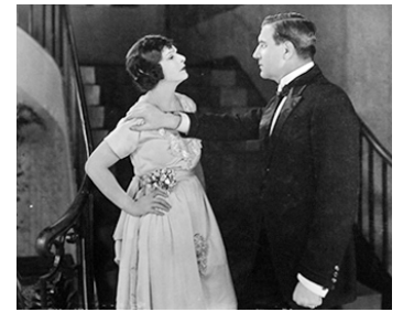
1921 LE SIGNE SUR LA PORTE (The Sign of the Door) d'Herbert Brenon avec Charles Richman