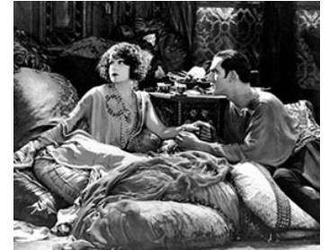
1923 FLEUR DES SABLES (The Song of Love) de Chester Franklin avec Joseph Schildkraut