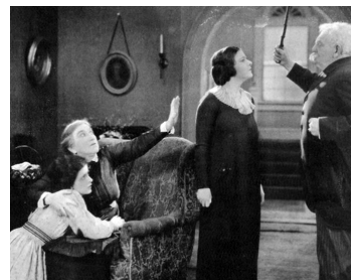
1919 POUR SA FAMILLE (The Way of a Woman) de R. Leonard avec May McAvoy, D. DeVernon