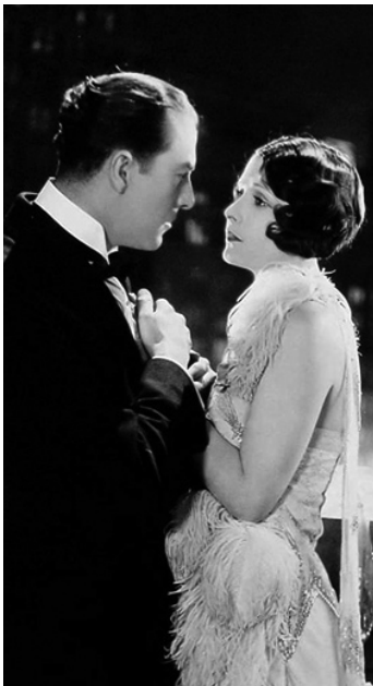
1925 GRAUSTARK de Dimitri Buchowetzki avec Eugene O'Brien