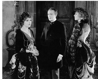
1924 SECRETS (Secrets) de Frank Borzage avec Eugene O'Brien, Gertrude Astor