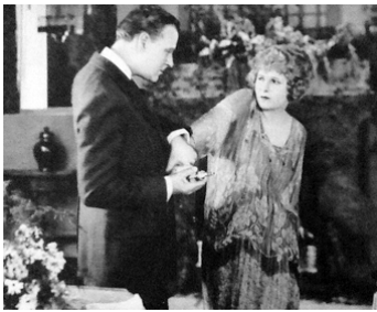
1920 OUI OU NON ? (Yes of no) de Roy William Neill avec Frederick Button