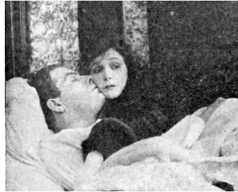
1916 PANTHEA (Panthea) d'Allan Dwan avec Earle Foxe