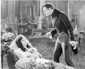
1922 LA DUCHESSE DE LANGEAIS (The Eternal Flame) de Frank Lloyd avec Conway Tearle