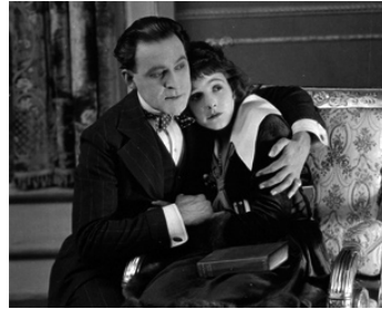
1917 THE LAW OF COMPENSATION de J. Steger & Joseph A. Golden avec Chester Barnett