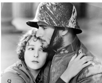
1928 SOIRS D'ORAGE (The Woman disputed) d'Henry King avec Gilbert Roland