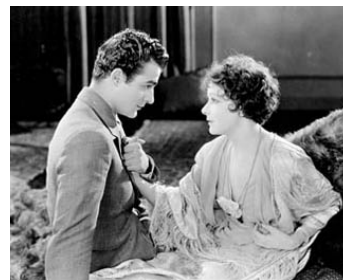
1927 LA DAME AUX CAMÉLIAS (Camille) de Fred Niblo avec Gilbert Roland