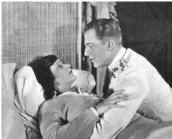
1918 LES HIRONDELLES (The safety Curtain) de Sidney A. Franklin avec Eugene O'Brien