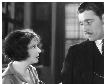
1926 KIKI (Kiki) de Clarence Brown avec Ronald Colman