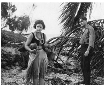
1919 L'ÎLE DÉSERTE (The Isle of Conquest) d'Edward José avec Wyndham Standing