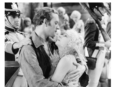
1930 MADAME DU BARRY (Du Barry woman of Passion) de Sam Taylor avec Conrad Nagel