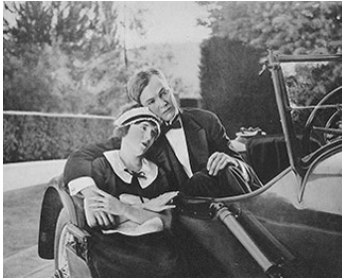
1921 THE WONDERFUL THING d'Herbert Brenon avec Harrison Ford