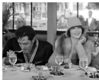
1928 MIRAGES (Show People) de King Vidor avec Gilbert Roland