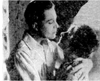
1921 LOVE'S REDEMPTION d'Albert Parker avec Harrison Ford