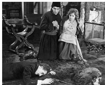
1919 DANS LA NUIT (The New Moon) de Chester Withey avec Stuart Holmes, Pedro de Cordova