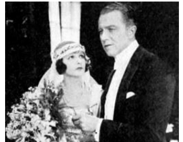
1918 HER ONLY WAY de Sidney A. Franklin avec Eugene O'Brien