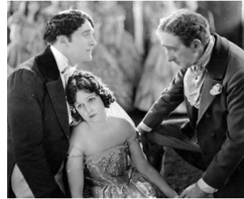
1922 CHAGRIN D'AMOUR ((Smilin' through) de S. Franklin avec W. Standing, Alec B. Francis