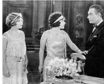
1923 AU-DESSUS DES LOIS (Within the Law) de F. Lloyd avec Natalie Talmadge, Lew Cody