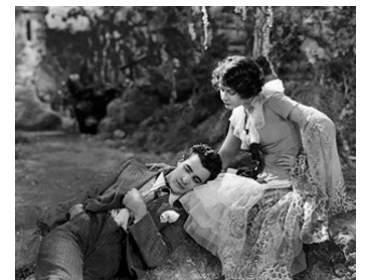
1927 LA COLOMBE (The Dove) de Roland West avec Gilbert Roland