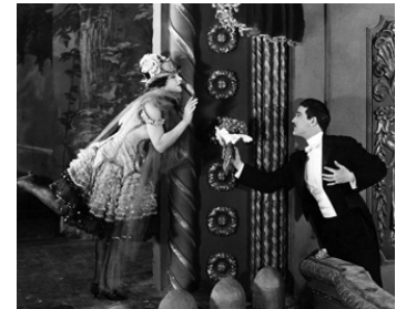
1924 SA VIE (The Lady) de Frank Borzage avec Wallace McDonald