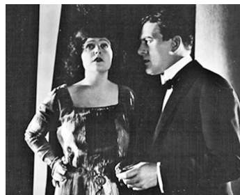
1919 ÉPOUSE À L'ESSAI (The Probation Wife) de Sidney A. Franklin avec Thomas Meighan